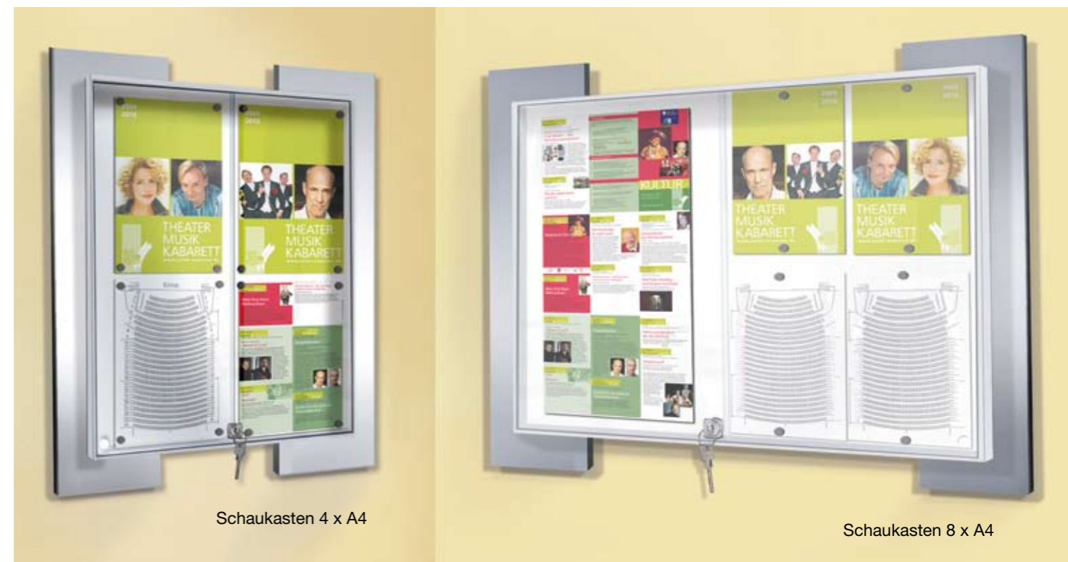
Schaukasten 4 x A4