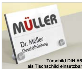
Türschild DIN A6 als Tischschild einsetzbar